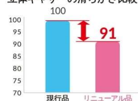
立体ギャザーの滑らかさ比較