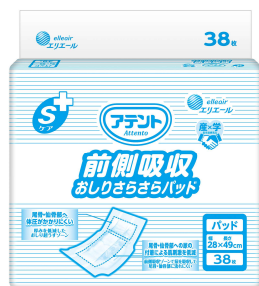
『アテント Sケア 前側吸収 おしりさらさらパッド』

衛生用紙製品 No.1 ブランド ※1 の「エリエール」を展開する大王製紙株式会社（本社：東京都千代田区）は、産学連携商品であるパッドタイプの大人用紙おむつ『アテント Sケア 前側吸収 おしりさらさらパッド』の摩擦を低減して使いやすさを向上させ、2024年9月20日（金）から全国の病院・介護施設等向けにリニューアル発売します。