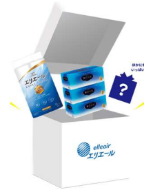
「エリエールびっくりBOX」イメージ

『The エリエール トイレティッシュ』や『エリエール 贅沢保湿ティッシュ』など、 家族みんなで使えるエリエール商品を詰め合わせたセット。 どんな商品が入っているかは開けてからのお楽しみ！