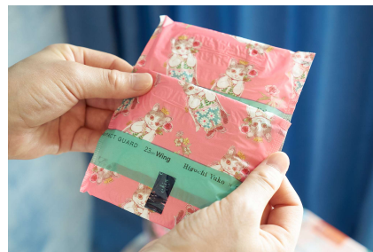
エリス コンパクトガード ヒグチユウコ コラボデザイン 23cm 羽つき