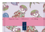
23cm 羽つき ふんわりタイプ