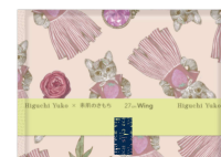
27cm 羽つき ふんわりタイプ