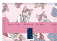
23cm 羽つき 超スリムタイプ