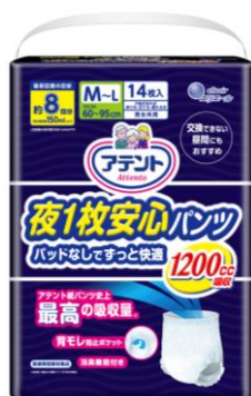
アテント 夜1枚安心パンツ パッドなしでずっと快適 M～L 男女共用 14枚

大王製紙株式会社（住所：東京都千代田区）は、パンツ 1枚でモレない安心感と快適なはき心地を追求した「アテント夜 1枚安心パンツ パッドなしでずっと快適」を 2018年10月21日（日）より新発売します。