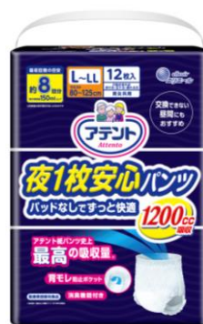
アテント 夜1枚安心パンツ パッドなしでずっと快適 L～LL 男女共用 12枚