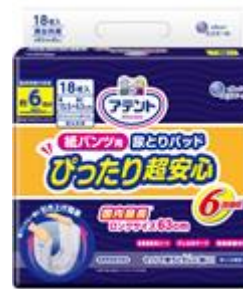
アテント 紙パンツ用尿とりパッド ぴったり超安心 6回吸収 18枚