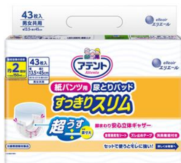
アテント 紙パンツ用尿とりパッドすっきりスリム 2回吸収 43枚

大王製紙株式会社（住所：東京都千代田区）は、紙パンツ用尿とりパッドにうすさを求める生活者に向けて、「アテント紙パンツ用尿とりパッド すっきりスリム 2回吸収」を2018年9月21日（金）より新発売します。