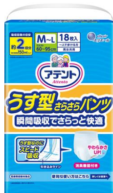
アテント うす型さらさらパンツ 男女共用 M-L サイズ 18 枚

エリエールブランドの大王製紙株式会社(住所:東京都千代田区富士見二丁目 10 番 2 号)は、お腹まわりのやわらかさを向上させ、生活者により快適なはきごころをご提供するため、『アテント うす型さらさらパンツ』を平成 29 年 10 月 21 日(土)よりリニューアル発売します。