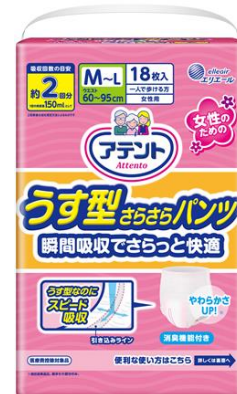
アテント うす型さらさらパンツ 女性用 M-L サイズ 18 枚