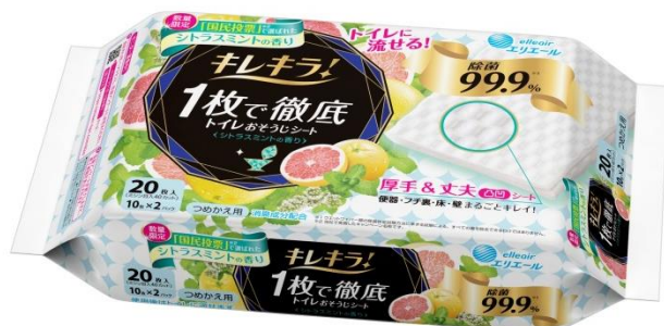
キレキラ！1枚で徹底トイレおそうじシート シトラスミント つめかえ用20枚(10枚×2P)