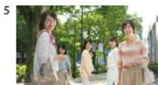
女性A「そりゃそうよね」 女性B「うん」