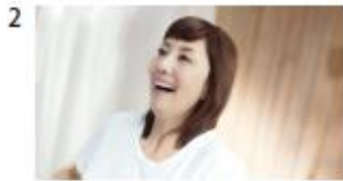
肌にふれるものは