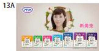
戸田さん 「その吸水パッド、 コットン？」