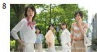
女性達「えー!？」 女性A「今までのコットンじゃ なかったの？」