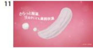
汗をかいても素肌快適。