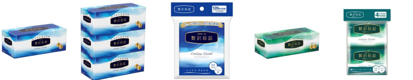
エリエール贅沢保湿 1P エリエール贅沢保湿 3P エリエール贅沢保湿 エリエール贅沢保湿 エリエール贅沢保湿 ポータブル1P 鼻爽快メントール1P 鼻爽快メントールポケット4P

エリエールブランドの大王製紙株式会社(住所:東京都千代田区富士見二丁目 10 番 2 号)は、「よりやわらかく」「よりなめらか」な肌ざわりとした『エリエール贅沢保湿』を平成 28 年 9 月 21 日よりリニューアル発売します。