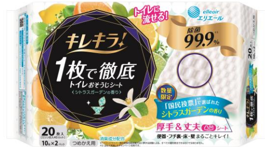
キレキラ！1枚で徹底トイレおそうじシート シトラスガーデン つめかえ用20枚(10枚×2P)