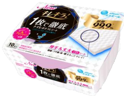
キレキラ！1枚で徹底トイレおそうじシート 本体10枚

※1 当社調べ。 ※2 ウェットワイパー類の除菌性能試験方法に準ずる試験による。すべての菌を除菌できるわけではありません。