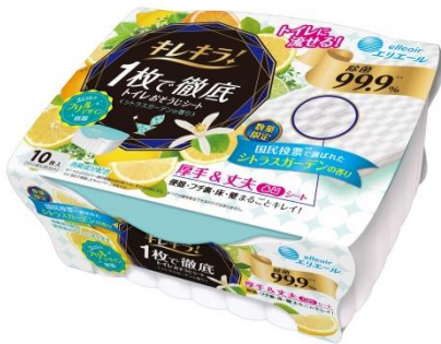
キレキラ！1枚で徹底トイレおそうじシート シトラスガーデン 本体10枚

6月21日(火)に発売する数量限定のフレグランス「キレキラ！シトラスガーデン」は、夏のそよ風にハーブが香るお庭をイメージしたさわやかな香りです。本体の色も限定色のすっきりとしたブルーグリーンです。ぜひお手にとってお試しください。