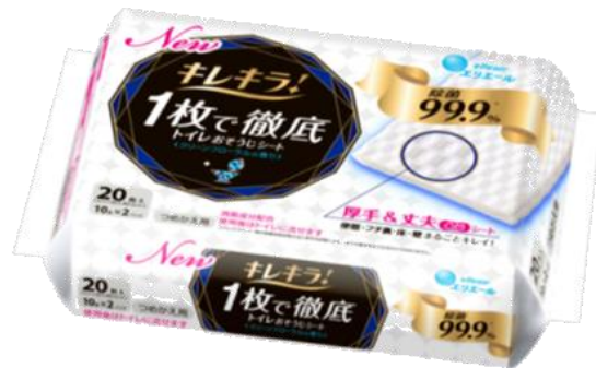
キレキラ！1枚で徹底トイレおそうじシート つめかえ用10枚/20枚