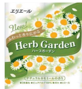
エリエールハーブガーデン カモミール