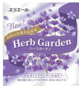
エリエールハーブガーデン ラベンダー