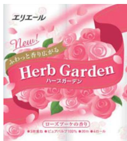
エリエールハーブガーデン ローズ

エリエールブランドの大王製紙株式会社（住所：東京都千代田区富士見二丁目10番2号）は、開封するまでパッケージに香りを閉じ込め、新鮮な香りを楽しむことができる『エリエールハーブガーデントイレットティッシュ（3枚重ね）』を2016年4月21日よりリニューアル発売します。