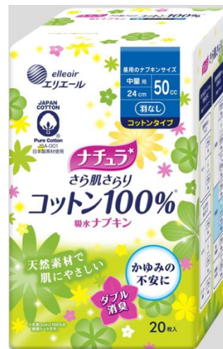
ナチュラさら肌さらりコットン 100%吸水ナプキン中量用