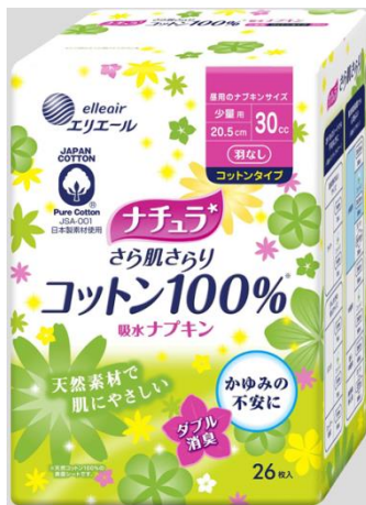
ナチュラさら肌さらりコットン 100%吸水ナプキン少量用