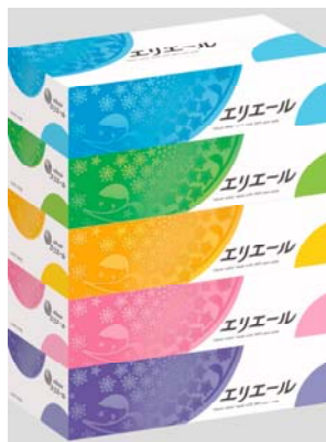
エリエールティシュー180組5個パック

エリエールブランドの大王製紙株式会社(住所:東京都千代田区富士見二丁目10番2号)は、きめ細やかな『なめらかさ』で鼻が赤くなりにくい『エリエールティシュー』を2015年10月21日より全国発売します。