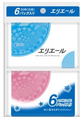
エリエールティシュー(ポケット)10組6個パック