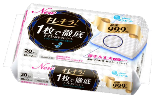
キレイラ! 1枚で徹底トイレおそうじシート 詰め替え20枚(10枚×2P) /詰替10枚