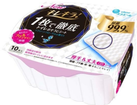
キレイラ! 1枚で徹底トイレおそうじシート 本体10枚

※1 当社調べ。 ※2 ウェットワイパー類の除菌性能試験方法に準ずる試験による。すべての菌を除菌できるわけではありません。