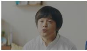
バカリズムさん 「夫婦円満の秘訣ですか?」