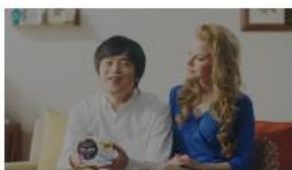
バカリズムさん 「やっぱり、エリエールの」