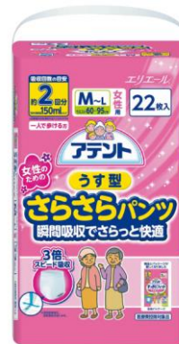
アテントうす型さらさらパンツ女性用 瞬間吸収でさらっと快適