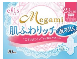
エリス Megami 肌ふわリッチ超スリム 多い日の昼用 羽つき