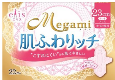
エリス Megami 肌ふわリッチ 多い日の昼用 羽つき

エリエールブランドの大王製紙株式会社(住所:東京都中央区八重洲 2-7-2)は、肌へのやさしさにこだわりぬいた生理用ナプキン「elis(エリス)Megami」のネーミングを、『肌ふわリッチ/肌ふわリッチ超スリム』に改め 2015年2月21日リニューアル発売します。